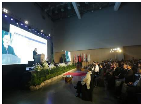
东亚海大会闭幕式

除上述论坛外，PNLG 各成员城市还派出青年代表，参与到本届东亚海大会的青年论坛中，提高本国青年的海洋意识，为今后的海岸带综合管理储备人才。