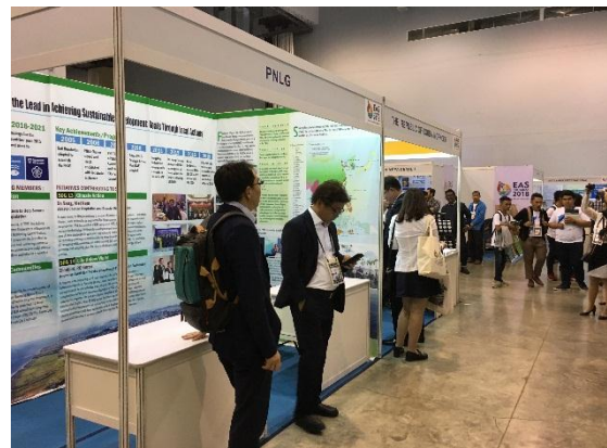
与会代表参观 PNLG 展位

作为本届东亚海大会伙伴关系论坛的召集人，11 月 28 日下午，PNLG 举办了“政府治理与伙伴关系”分论坛。本次会议由 PNLG 主席 Noraini Binti Roslan 女士主持。东亚海伙伴关系委员会荣誉主席、2018 年东亚海大会国际会议主席蔡程瑛博士向大会作了题为“地方政府 25 年的实践与合作”