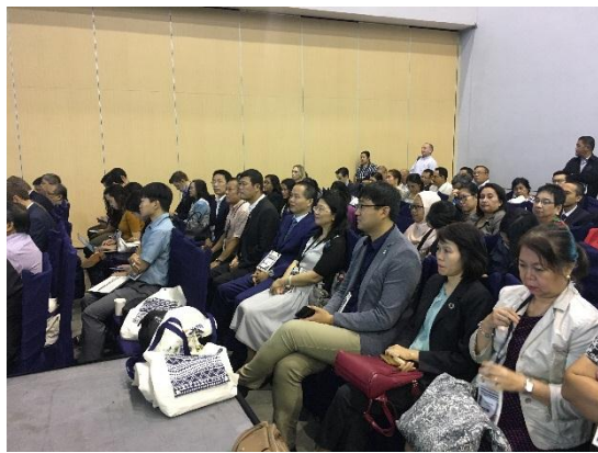
PNLG 成员代表出席 2018 年东亚海大会

11 月 27 日，PNLG 成员代表出席了 2018 年东亚海大会开幕式、展览剪彩仪式及东亚海大会伙伴关系论坛，听取了各国专家对海洋塑料垃圾防治、东亚海蓝碳研究网络建设、蓝色经济发展与联合国可持续发展目标等一系列海洋前沿议题的最近研究成果。