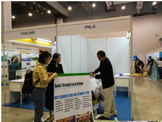
PNLG 秘书处工作人员连夜布置展台