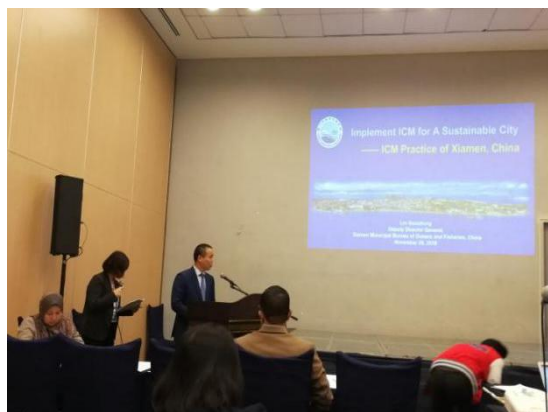
厦门代表在 PNLG 分论坛上发言

的主旨报告，简要回顾了包括厦门在内的 PNLG 各成员地方政府 25 年来在实施海岸带综合管理方面的努力及成果。来自马来西亚、中国、越南及菲律宾的 PNLG 成员代表分别围绕联合国 2030 可持续发展目标进行了发言，分享了各自在实现相应目标过程中所作出的努力及取得的经验。