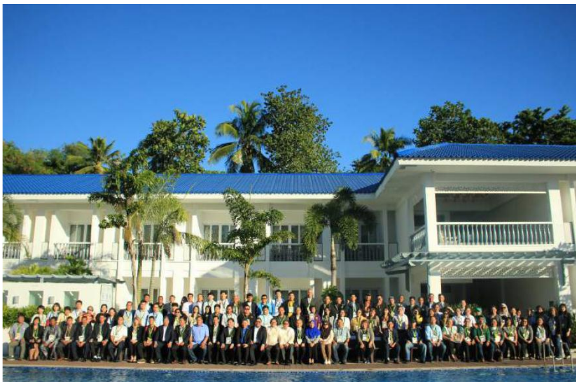
2018 年 PNLG 年会全体参会人员合影

2018 东亚海岸带可持续发展地方政府网络（PNLG）年会于 11 月 29 日在菲律宾吉马拉斯省举行，共有来自柬埔寨、中国、印度尼西亚、日本、马来西亚、菲律宾、韩国、泰国、越南、东帝汶等 10 国以及东亚海环境管理区域组织（PEMSEA）、厦门大学和中国的 PEMSEA 中心等国际组织和机构的逾百名代表出席会议。