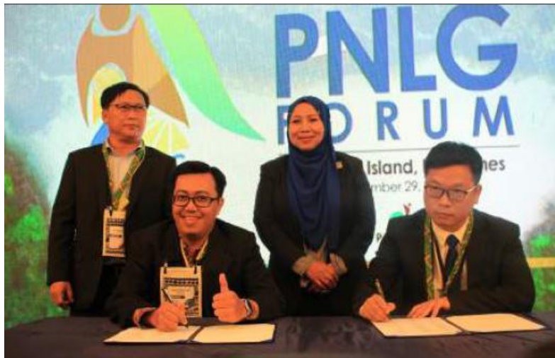
新成员城市代表签署《PNLG 章程》