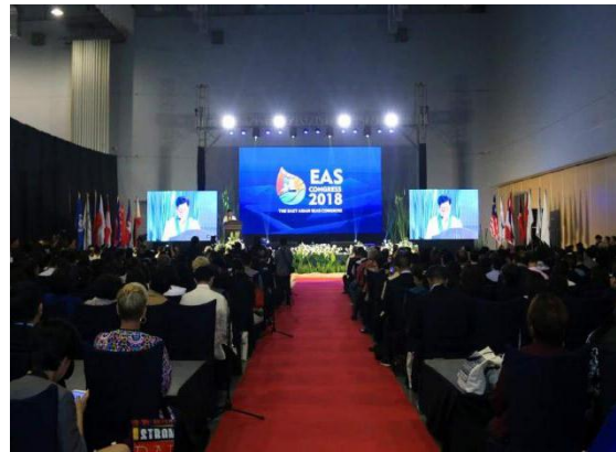
2018 年东亚海大会开幕式

11 月 27 日，PNLG 成员代表出席了 2018 年东亚海大会开幕式、展览剪彩仪式及东亚海大会伙伴关系论坛，听取了各国专家对海洋塑料垃圾防治、东亚海蓝碳研究网络建设、蓝色经济发展与联合国可持续发展目标等一系列海洋前沿议题的最近研究成果。