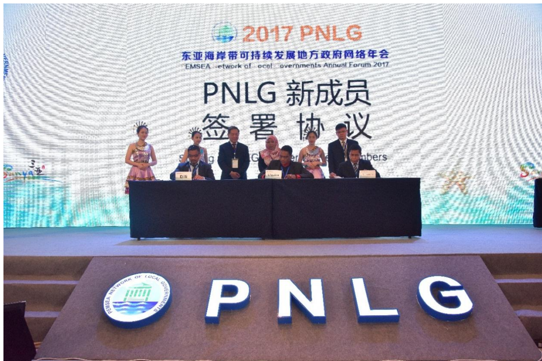
新成员代表签署《PNLG 章程》

秘书处在年会上引荐了东帝汶帝力、马纳图托和利基卡加入 PNLG 并签署《PNLG 章程》，至此 PNLG 正式成员增至 48 个。