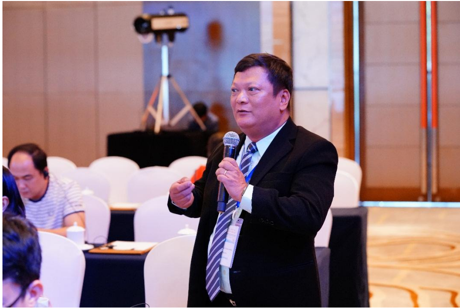
与会嘉宾就《PNLG 基金管理指南》进行提问