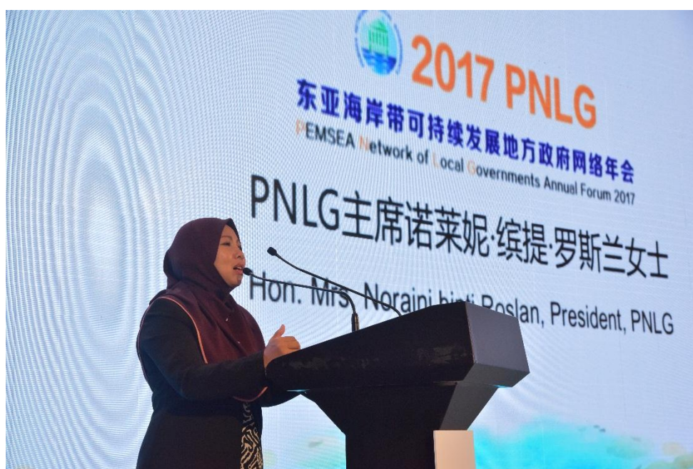
PNLG 主席诺莱妮·缤提·罗斯兰女士致欢迎辞