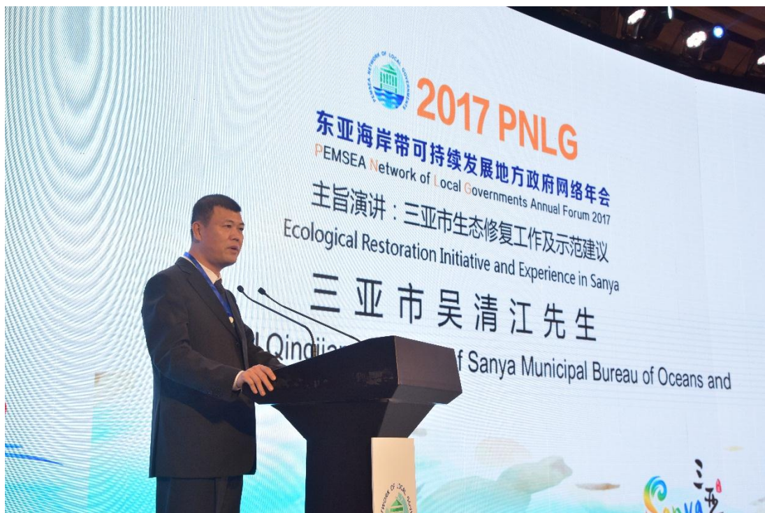
三亚市海洋与渔业局局长吴清江先生做主旨演讲

年会开幕式后，三亚市海洋与渔业局局长吴清江先生做了题为“三亚市生态修复工作及示范建议”的主旨演讲，就三亚的海域现状、生态修复工作进展及生态修复过程中总结的经验和建议进行了分享。