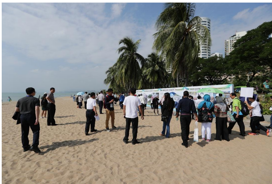
与会嘉宾考察三亚湾岸滩工程人工补沙工程

会议结束后，与会嘉宾乘坐大巴对三亚湾岸滩工程人工补沙工程、亚龙湾青梅港红树林自然保护区和蜈支洲岛旅游区进行了实地考察。