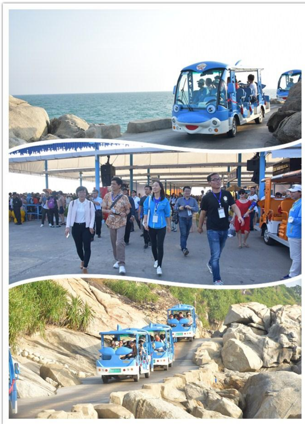
与会嘉宾在蜈支洲岛上进行考察