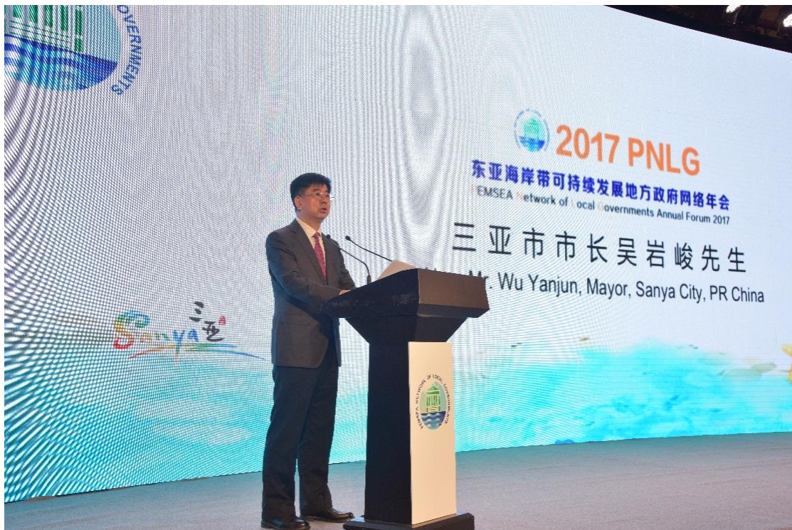
三亚市市长吴岩峻先生致欢迎辞