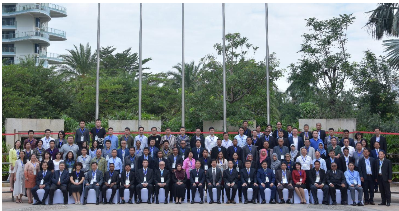
2017 年 PNLG 年会全体参会人员合影

2017 年东亚海岸带可持续发展地方政府网络（PNLG）年会于 12 月 4 至 7 日在中国海南省三亚市举行，共有来自中国、柬埔寨、印度尼西亚、马来西亚、菲律宾、韩国、泰国、东帝汶和越南等 9 个国家的 31 个 PNLG 成员的 114 名代表出席了会议，来自厦门大学、泰国宋卡大学和日本海洋政策研究所等科研机构的专家学者分享了生态修复前沿科技成果并回答了成员的问题。